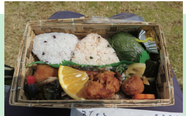
地元食材を利用したお弁当