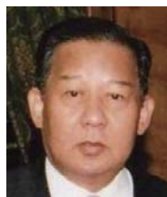
衆議院議員 自由民主党和歌山県連会長 二階俊博