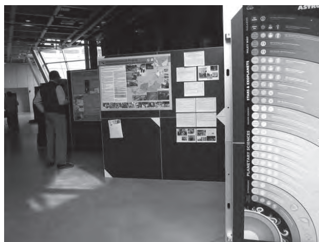
図5 ポスター会場の様子

ニュアルの必要性を考えた。現在、日本語版のマニュアルしかなく、英語版の製作が急がれる。