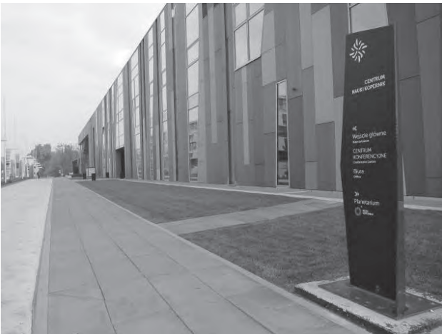
図2 コペルニクス・サイエンス・センター外観

が必要となる。このミーティングは、さまざまな天文や宇宙を用いたアウトリーチ活動の取り組みを紹介・共有する場を提供し、それらに関わる様々な人々を結びつけ、互いに協力する機会を提供する事を目的とする。