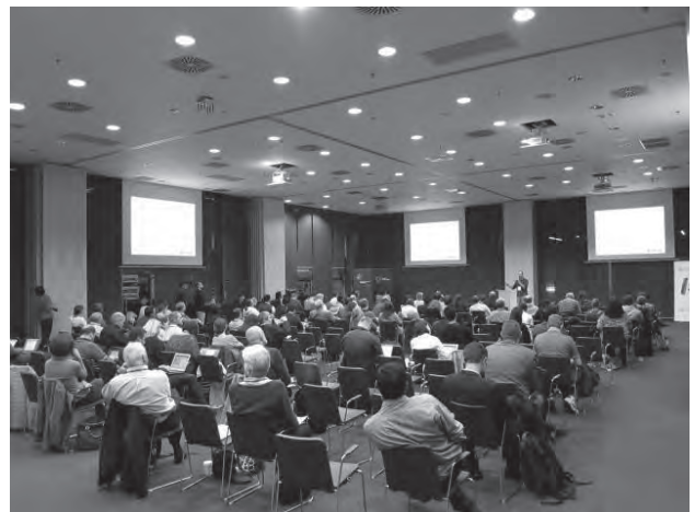
図3 CAP2013メイン会場の様子

CAP2013ミーティングの口頭発表は、主にセンターに併設された会議スペースで行われた(図3参照)。ミーティングは5日間にわたり、参加者はのべ200人を超え、その参加国は37ヶ国にわたる。ヨーロッパをはじめ